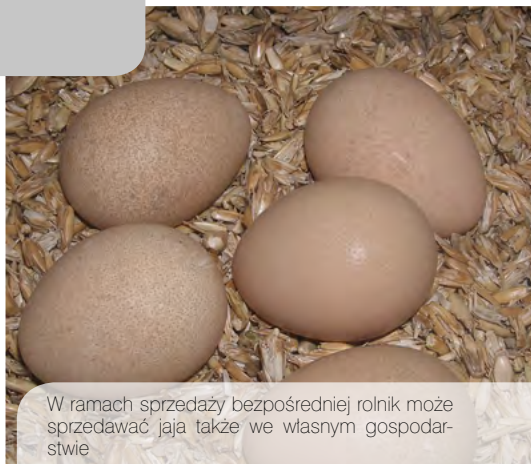
W ramach sprzedaży bezpośredniej rolnik może sprzedawać jaja także we własnym gospodarstwie

Sprzedaż bezpośrednia – sprzedaż do konsumenta końcowego lub lokalnego zakładu detalicznego zaopatrującego konsumenta końcowego surowców pochodzących z produkcji podstawowej, tuszek drobiowych, za-